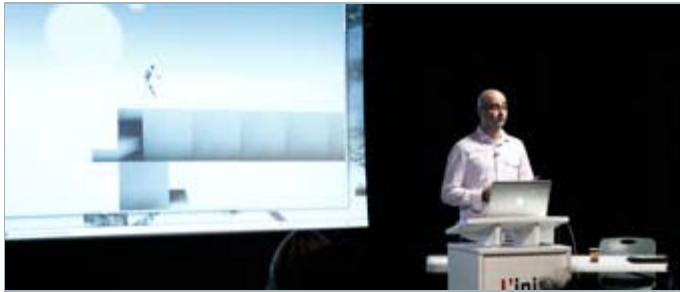
Présentation de Stéphane Coco | Photo: L'inis

Conclusion du programme Médias interactifs