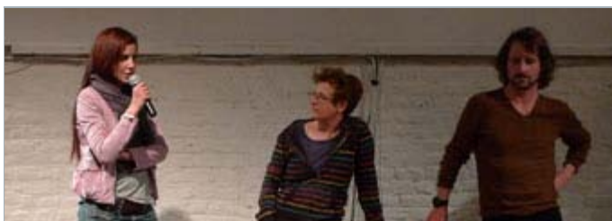
Présentation du film «Villeraymmit» de Kenza Afsahi