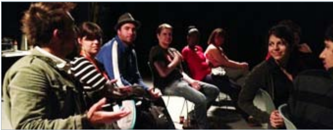
Visite des étudiants de l'école Chomedey-Maisonneuve