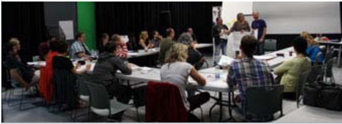
Atelier transmédia Globalex