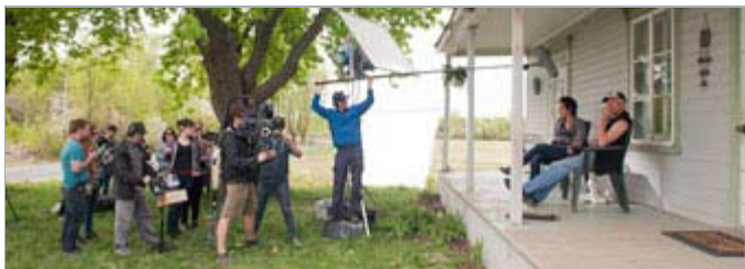
Sur le plateau du film «À l'horizon» | Photo: Véro Boncompagni

Il y a des semaines comme ça où l'actualité est telle que ça vaut la peine de retarder la diffusion du bulletin!