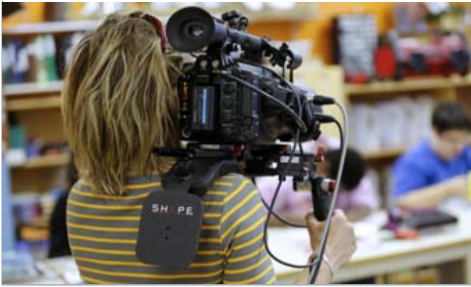
Photo du tournage du film «Prête, pas prête» de Judith Plamondon