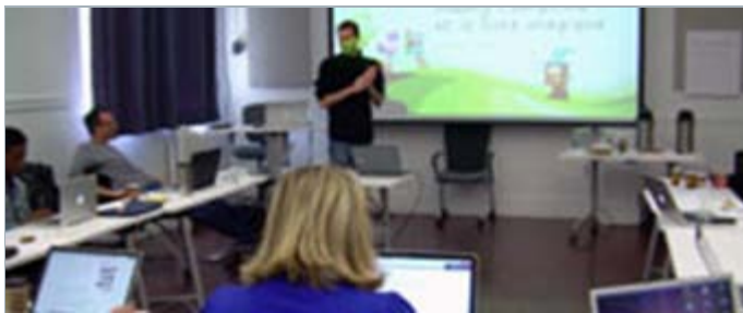
Bootcamp du programme Médias interactifs