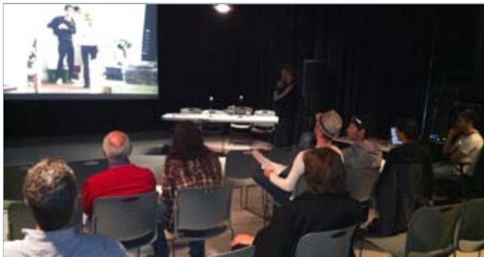
Retour critique avec les techniciens de TVA | Photo: L'inis