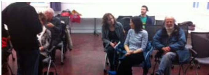
Séance de projection de la série «J'ai oublié de vous dire»