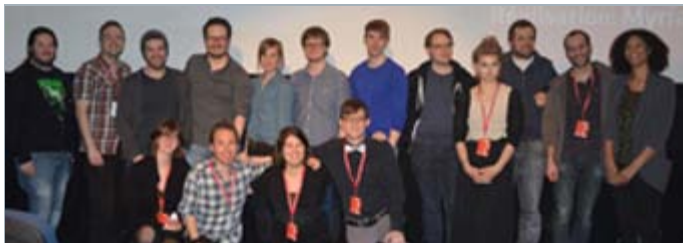
Photo de la remise des prix lors du FFR