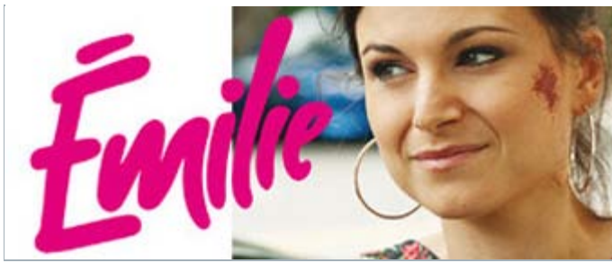
«Émilie» de Guillaume Lonergan