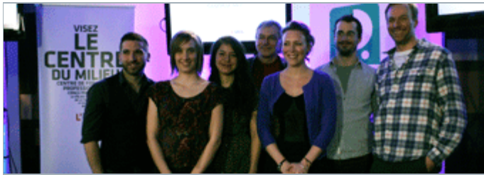
Les participants de l'atelier «Closed Set»