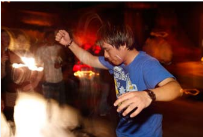
Image du film «Thank you for Calling»