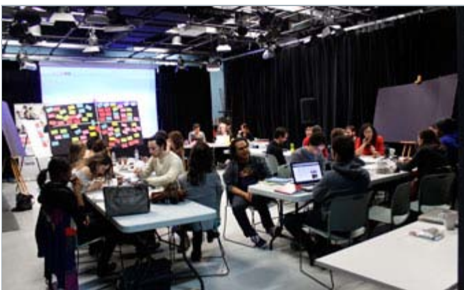
Atelier de créativité transmédia Globalex

Même s'il s'agit d'un terme scientifique qui définit un phénomène physique, on aime parler de ce succès professionnel comme le résultat d'un processus de percolation. Est-ce la confirmation de ce phénomène? l'année 2013 s'annonce comme une année qui mettra en lumière plusieurs de nos diplômés ayant complété leur formation il y a quelques années. Ils sont en effet nombreux ceux qu'il faudra surveiller au cours des prochains mois. On pourra alors prendre toute la mesure de leur contribution au monde du cinéma, de la télévision et des médias interactifs du Québec et, pourquoi pas, de l'étranger!