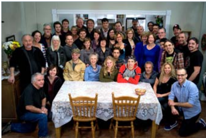
Équipe des tournages du programme Télévision