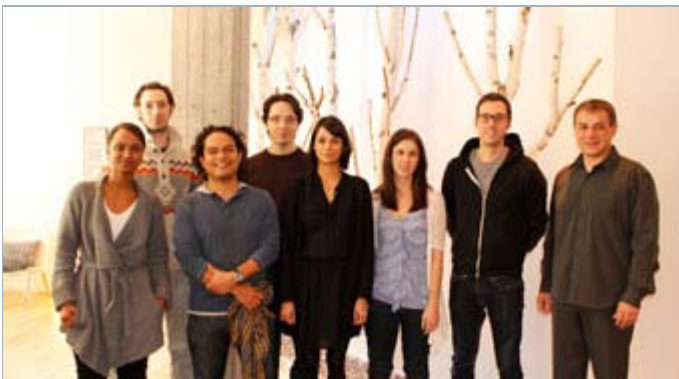
La cohorte du programme Documentaire 2013