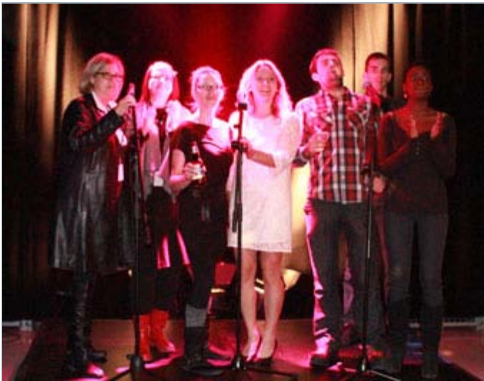
Une partie de la cohorte Médias interactifs 2012-2013