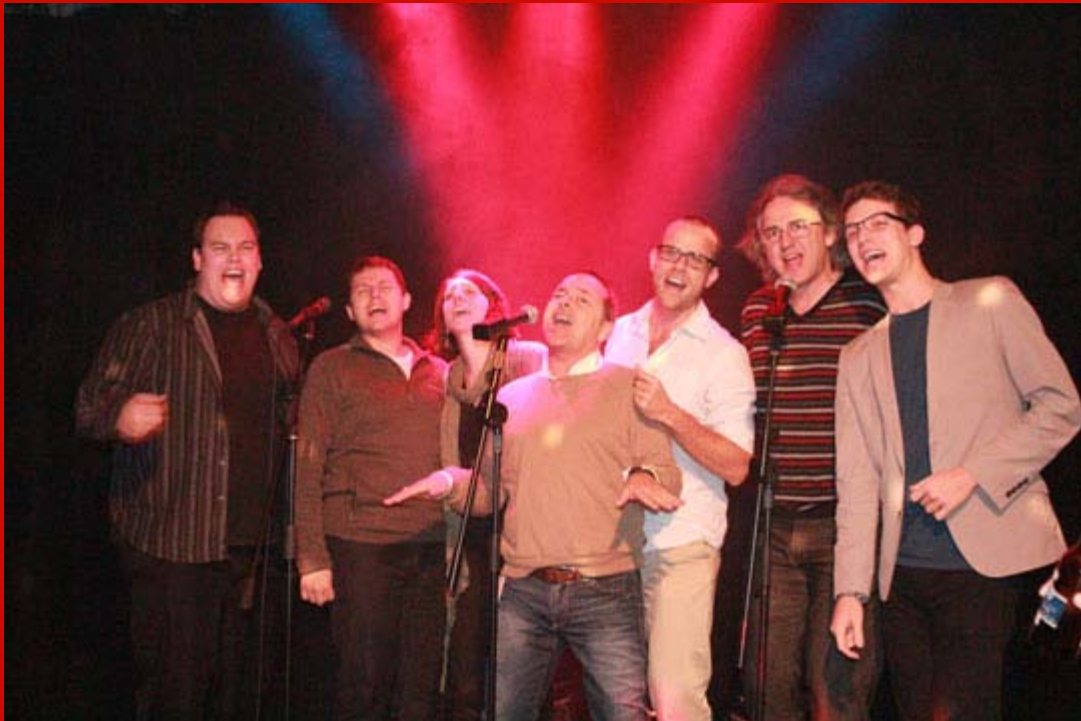
Une partie de la cohorte du programme Télévision... complètement déchaînée!

Les programmes de formation de L'inis sont intenses. Entre les cours et les exercices pratiques (avec tout ce que cela comporte de préparation), la charge de travail est importante et le temps file à grande vitesse.