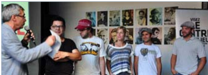
Les participants lors du tirage au sort des contraintes