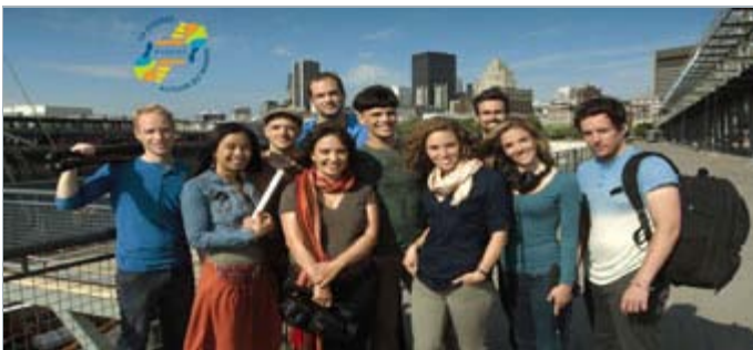
Les participants de la Course 2012

«Je les aime encore», réalisé par Marie-Pierre Grenier et produit par Philippe Miquel (Documentaire 2010), sera présenté au Milwaukee Film Festival qui aura lieu du 27 septembre au 11 octobre 2012. 23-08-12