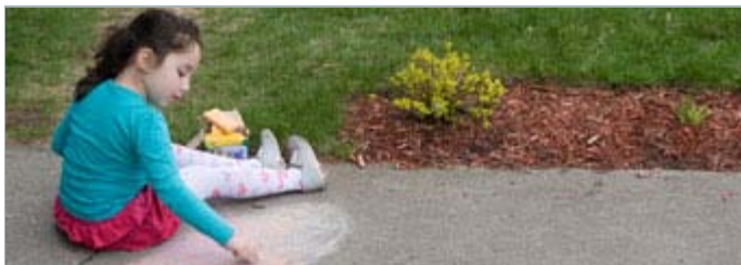
Sur le tournage de «En attendant Oktay»