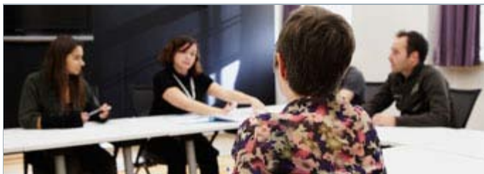
Séance d'information