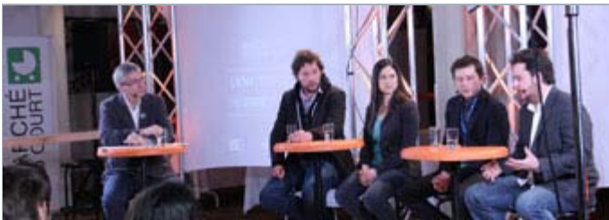
Pendant l'atelier «L'États des choses» au Festival Regard sur le court métrage au Saguenay

Ça s'est passé à Regard sur le court métrage au Saguenay