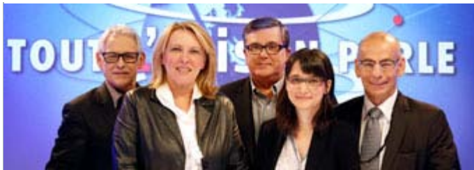
L'animateur et ses invités