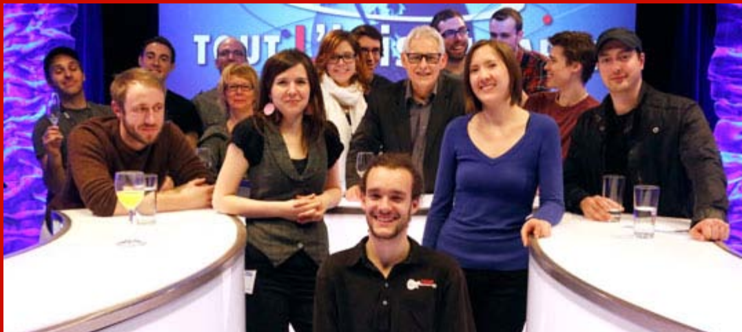
L'équipe derrière la réalisation de «Tout L'inis en parle»

À L'inis, on aime faire les choses différemment. Nous l'avons encore démontré le vendredi 4 mai à l'occasion de l'inauguration de nos nouvelles installations techniques. Plutôt que d'inviter la ministre Christine St-Pierre à faire un discours et à couper un ruban, nous avons choisi de la faire participer à une démonstration de ce à quoi allait servir les équipements fraîchement acquis.