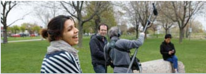
Sur le tournage de «Evelyn» de Ghazal Sotoudeh