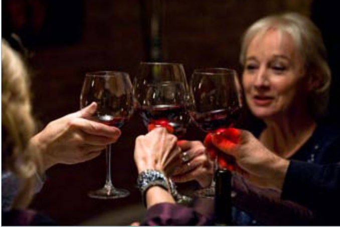
Sur le tournage du film «Le trou normand»