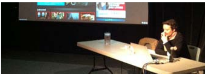
Jérôme Hellio