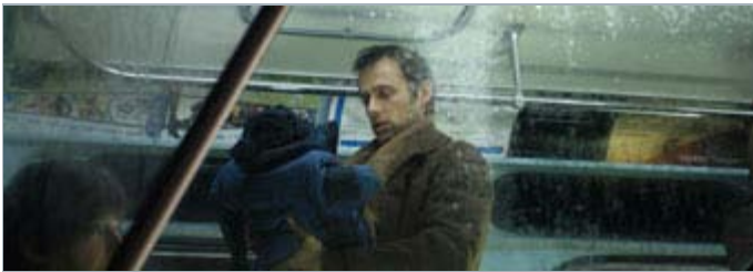
Image tirée du film «Un ange passe»