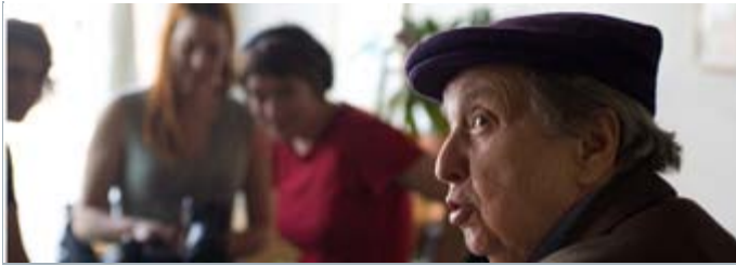
Sur le tournage de «Je les aime encore»