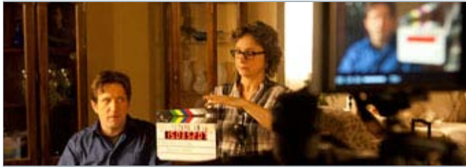
Sur le plateau de tournage à TVA