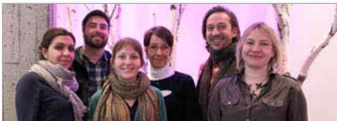
La cohorte du programme Documentaire 2012

Dans l'effervescence du moment, il faudra donc faire attention de ne pas se brûler et prendre la vie, comme il convient, avec un brin de philosophie!