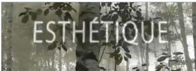
Image extraite de la bande-annonce de la Course 2011