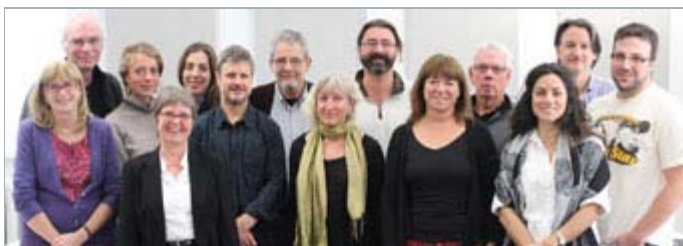
La cohorte du programme Écriture de long métrage

Le Festival du nouveau cinéma a beau prendre de l'âge, il ne vieillit pas! Et à 40 ans, il innove plus que jamais. L'inis est heureux d'en être un modeste partenaire et d'y retrouver deux de ses récentes productions. Un événement comme celui-là, avec sa volonté d'explorer de nouvelles formes d'expression, constitue, à sa façon, un excellent complément aux programmes de formation offerts par L'inis. Et, entre nous, quelle agréable façon d'apprendre! Bon festival!