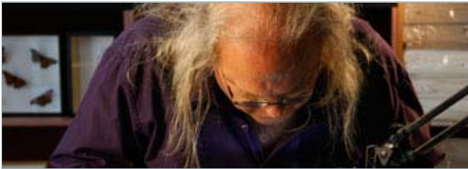
Sur le tournage du film «Des insectes et des hommes»