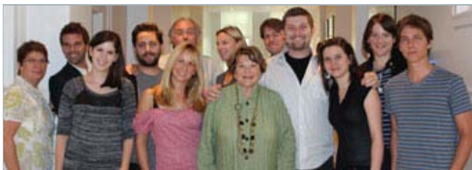
Les étudiants et le comité pédagogique

Bravo aussi à tous les professionnels en nomination, dont plusieurs partagent leur expertise et leur savoir-faire à titre de formateurs à L'inis.