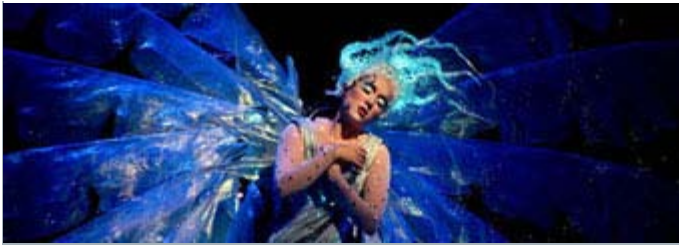
Image tirée du spectacle «Zed» qui a fait l'objet d'un documentaire réalisé par Vali Fugulin