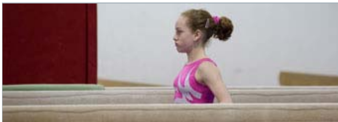
Image du film «Quand tout est possible»