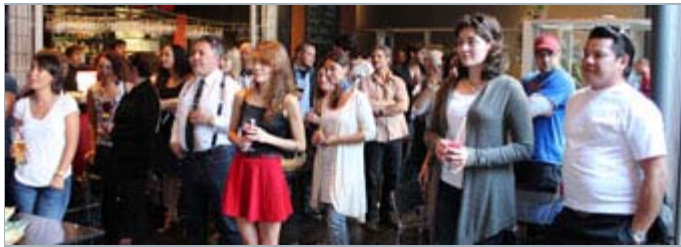
Pendant le cocktail de la rentrée

Les membres du réseau célèbrent le début d'une nouvelle année de formation