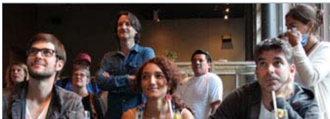
Les membres du jury en plein visionnement