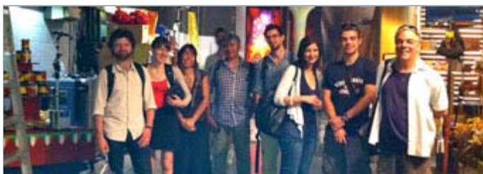
Les étudiants du programme Documentaire en visite

L'institut n'est ni une secte, ni un culte, mais il est important que son appel soit entendu par ceux qui veulent aussi faire partie du milieu du cinéma, de la télévision et des médias interactifs.