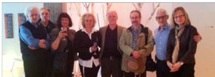
Les membres de la délégation lors du cocktail de fin de journée