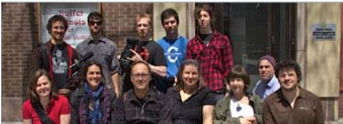
Les participants à la formation