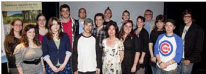
Les neuf participants à la Course entourés des organisateurs

Cette dernière Carte blanche de la saison aura lieu le mardi 7 juin. Donnée en anglais, elle portera sur le transmédia tel qu'expliqué par le spécialiste Evan Jones de Stich Media de Halifax. Un cocktail de réseautage de 17h à 17h30 précédera la conférence interactive. Le coût pour assister à cette conférence est de 30 $ (20 $ pour les membres de FCTNM, de même que pour les membres et les diplômés de L'inis). Les inscriptions peuvent être faites par téléphone au 514 842-8289 ou sur place, le jour-même. 25-05-11