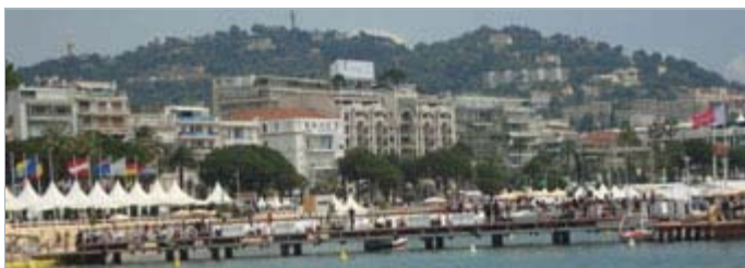
La Croisette vue depuis le kiosque de la SODEC

Après le labeur, le glamour! Nos étudiants et nos diplômés ont travaillé à la sueur de leur front, avec conviction et professionnalisme, et les voilà bien récompensés. Le tournage des derniers projets du programme Documentaire coïncide avec le Festival de Cannes: ça fait rêver... Un jour, eux aussi verront leur œuvre projetée à Munich ou leur savoir partagé à Gaspé. Peut-être même, qui sait?... jusqu'au bord de la Méditerranée! À L'inis, on se fait voir!