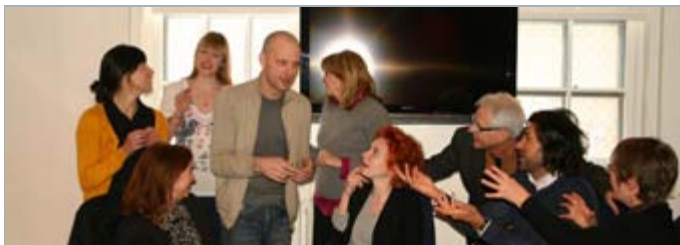
La cohorte ELM 2010-2011 et des membres du comité pédagogique