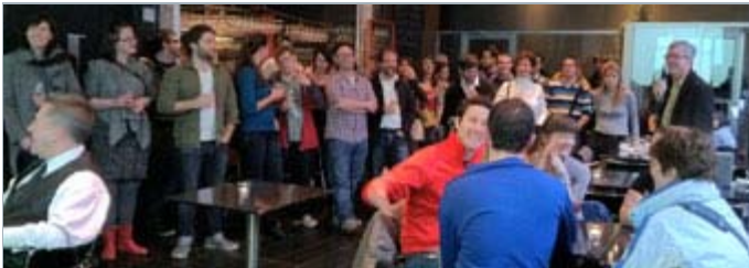
Une cinquantaine de diplômés ont participé au 5@7