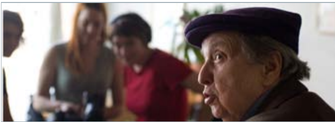
«Je les aime encore»