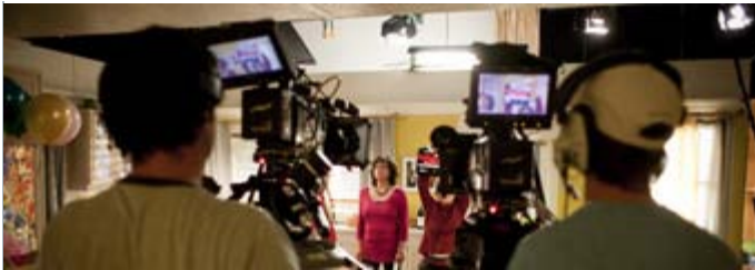
Plateau de la série «Les grands moyens»