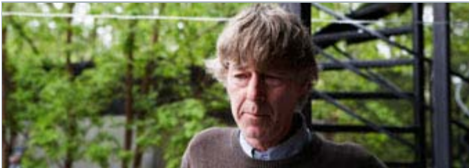
«L'absence qu'il reste» de Tobie Fraser