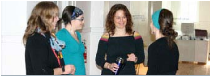
Quatres des participantes à la formation