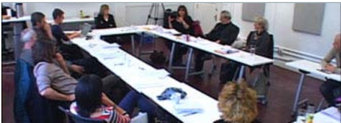
Le comité pédagogique, tuteurs et étudiants du programme Écriture de long métrage