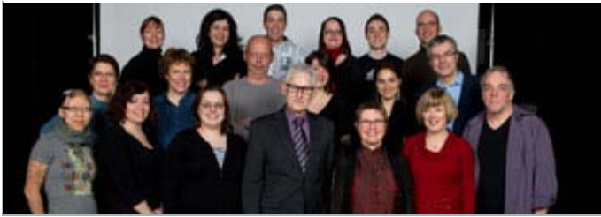
L'équipe de L'inis | Photo: Jean-Guy Thibodeau