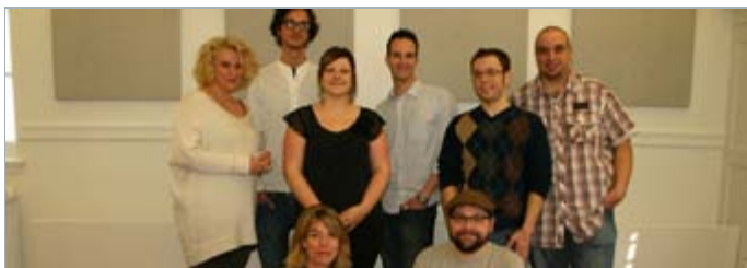
Cohorte Médias interactifs 2011 | Photo INIS