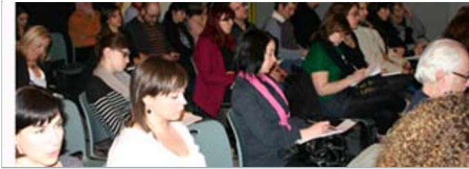
Pendant la réunion dans le studio de L'inis