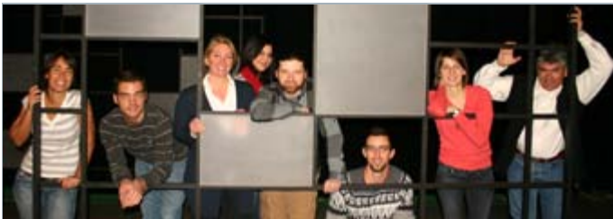
La cohorte Documentaire 2011

La modification au calendrier des programmes réguliers de L'institut entraîne le déplacement du programme Cinéma . Initialement prévu à l'automne 2011, il aura plutôt lieu au courant de l'hiver 2012. Ce report offre l'opportunité à L'inis d'entreprendre une révision de ce programme afin de l'ajuster lui aussi aux transformations de l'industrie cinématographique. Depuis 15 ans qu'il est en activité, L'inis a régulièrement procédé à de telles révisions. C'est l'une des raisons qui expliquent que ses programmes proposent, encore aujourd'hui, des contextes de formation reproduisant fidèlement les réalités du monde professionnel. Les changements annoncés au calendrier favoriseront également la collaboration des professionnels et des entreprises impliqués dans la production des différents projets et exercices. La date limite d'inscription du programme Cinéma sera connue ultérieurement. 20-01-11