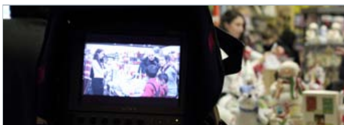
Sur le plateau de «Myriam-Amélie de Noël»

Avec notre cohorte Cinéma 2010 à deux pas de la fin de leur formation, on espère tous les voir transformés, prêts à affronter les écueils d'une vie professionnelle riche et passionnante. Attachez vos ceintures, on décolle!