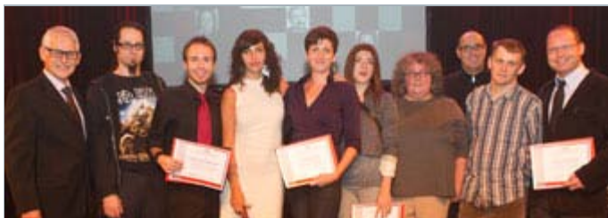
Une partie de la cohorte Médias interactifs reçoit ses attestations

Ils devront aussi continuer à demeurer sensibles aux transformations fréquentes que connaît le monde de l'audiovisuel et des communications. Une bonne façon de le faire est de fréquenter des événements comme le FNC Pro du Festival du nouveau cinéma, qui débute le 14 octobre, et auquel L'inis est très fier de collaborer.