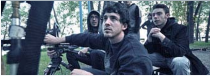
Sur le plateau de «La Reine Rouge» | Photo: Philippe Toupin