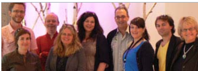
L'équipe du service de la formation professionnelle continue accompagnée de quelques formateurs

Pour assurer le bon fonctionnement, la croissance et la diversité des activités de création et de production au pays, on doit pouvoir compter sur la disponibilité d'une relève de qualité et le perfectionnement constant des professionnels en exercice. À ce chapitre, L'inis a la volonté de jouer pleinement son rôle. C'est pourquoi l'équipe du service de la formation professionnelle continue concocte, tout au long de l'année, des formations originales et adaptées aux besoins du milieu. Le contenu de ce bulletin en témoigne bien, et les suggestions sont toujours les bienvenues!