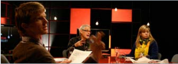
Préparation du plateau de «Au cœur du sujet»