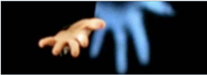
Image tirée de «Light Music»