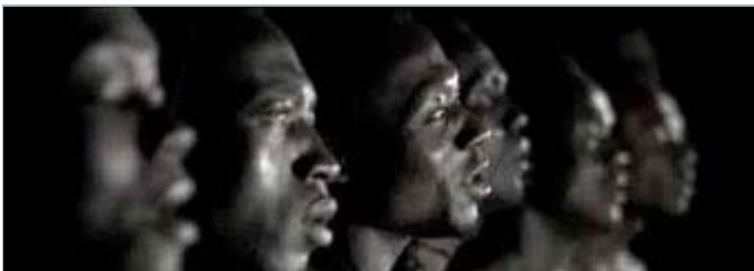
Image du clip «Aimer d'amour» de H'sao Réalisé par Henri Pardo et produit par Martin Berardelli