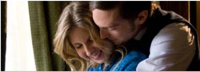
Image tirée du film «Le courage d'aimer»