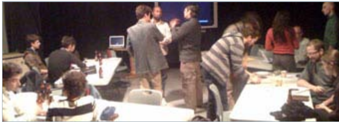
Les participants du jumelage au travail