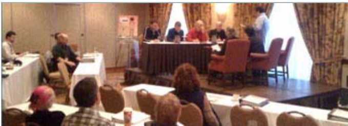
Conférence tenue dans le cadre de «Multiplatform, Multisuccess»