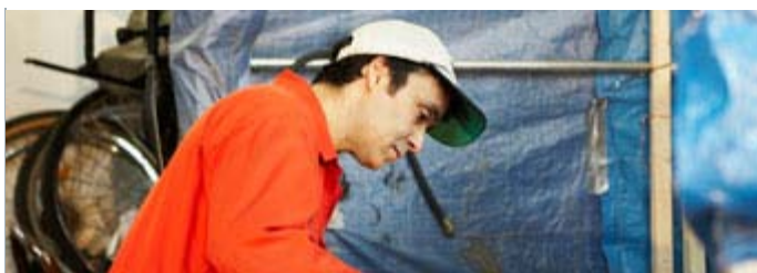
«Second cycle»