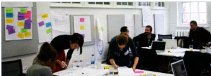
Participants du laboratoire Crossover Montréal