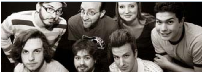
Les participants de la Course Estrie