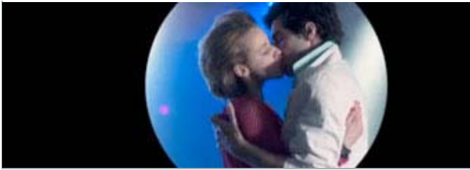
Image tirée du court métrage «Le Tyran des vues» | «Fais ça court !»