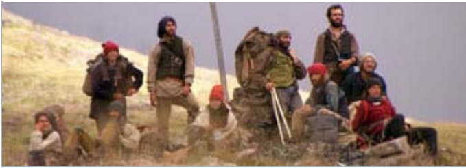
«Destination Nor'Ouest»