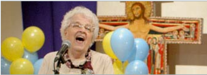
«Le Rendez-vous de Louise-Hélène»