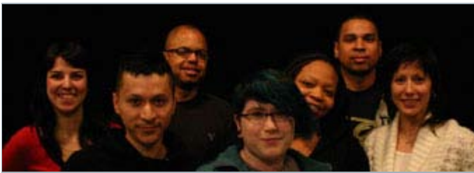
Les étudiants du programme Médias interactifs