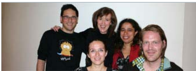
Cohorte Écriture de long métrage 2007

Maintenant, c'est dans l'obscurité des salles de montage que tout se joue! Malgré la fatigue, le sourire reste accroché aux lèvres de la plupart d'entre eux. C'est ce qui nous fait croire que l'expérience a été appréciée et qu'on puisse acclamer haut et fort: mission accomplie!