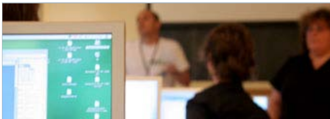
Vue de l'intérieur

D'ici quelques semaines, une fois qu'elles auront été validées par les services pédagogiques, toutes ces informations se retrouveront sur notre site Internet. Commencera alors le processus de recrutement qui comportera une innovation majeure cette année, une procédure de préinscription permettant d'obtenir un avis sur votre candidature avant de la déposer formellement. Fini les angoisses!